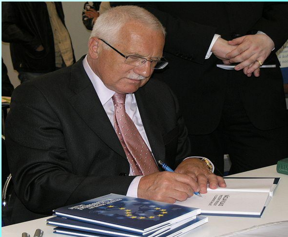
http://commons.wikimedia.org/wiki/File:Sv%C4%9Bt_knihy_2009_-_V%C3%A1clav_Klaus_2.jpg licence CC, (cit. 2012-11-28)