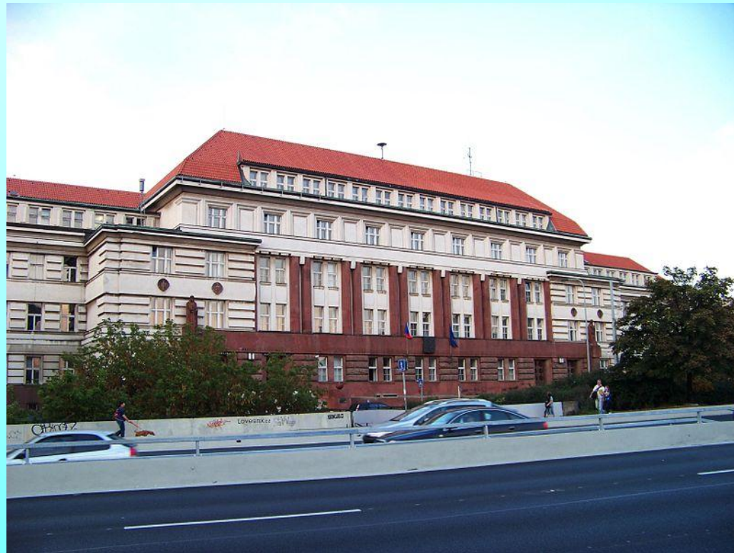
Budova vrchního soudu v Praze.