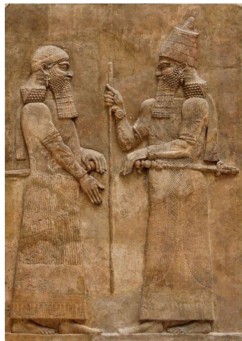
Sargon II. a hodnostář, reliéf z Dúr Šarrukínu