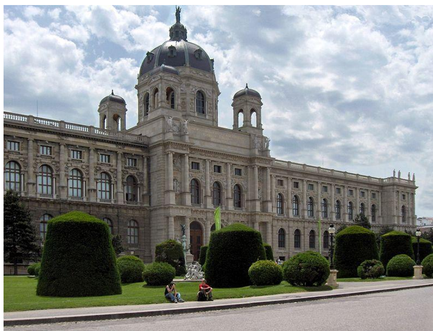
Autor: Georges Jansoone, licence Creative Commons, BY-SA http://cs.wikipedia.org/wiki/Soubor:Wien.Kunsthist02.jpg , licence CC

http://www.khm.at/de/?cHash=e71a757bc7c7cc1979219d71a7ae8eb1