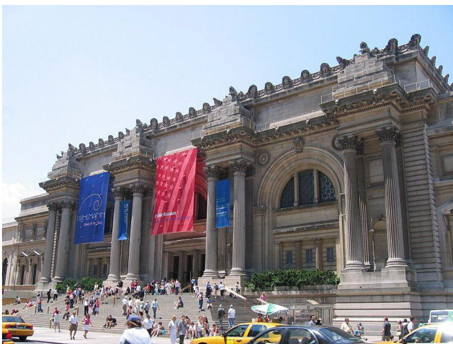
http://cs.wikipedia.org/wiki/Soubor:MET_entrance.jpg , licence PD